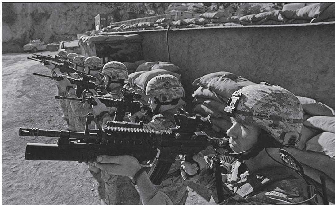
[2] En The Outpost (Rod Lurie, 2020), la Guerra contra el Terror es presentada como una mezcla de combat film y western .

estados-nación poderosamente organizados y poseedores de una sofisticada, potente, tecnología bélica; por el contrario, la segunda está integrada por diversas facciones transnacionales de clanes yihadistas (Al Qaeda, Frente Al-Nusra, Boko Haram, Estado Islámico / ISIS / Daesh 14 , Tehrik-i-Taliban...) de muy variada naturaleza militar (células terroristas, guerrilleros, fuerzas paramilitares), escasamente equipados y armados, y cuya principal estrategia consiste en una acción difusa, pero constante, que elude el choque directo a gran escala. Sin embargo, no se trata de un fenómeno nuevo. Las tácticas fabianas, desarrolladas por Quinto Fabio Máximo (280-203 a.C.), político y militar romano que combatió a Aníbal en el sur de la península itálica durante la Segunda Guerra Púnica (218-202 a.C.), fueron, sin