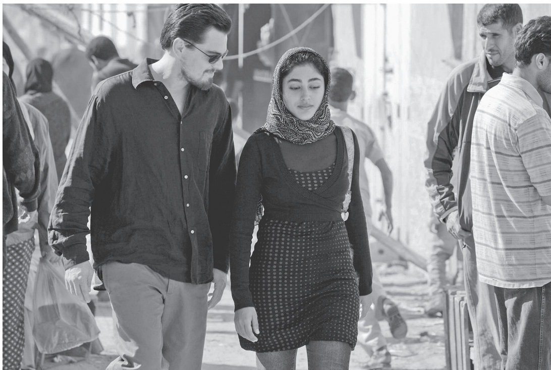
[3] Un mundo donde hay miedo y ansiedad sobre las impredecibles amenazas del terrorismo. Red de mentiras (Body of Lies, Ridley Scott, 2008).

nativa a las embrolladas y costosas guerras que derriban gobiernos y requieren años de ocupación estadounidense. En palabras de John Brennan, uno de los asesores más próximos del presidente Obama, al que este llegó a dar un empujón para dirigir la CIA, en lugar del «martillo» Estados Unidos ahora dependía del «escalpelo» [...]. La analogía sugiere que este nuevo tipo de guerra no tiene costes ni provoca meteduras de pata. Y no es así: ha creado enemigos al igual que los ha eliminado (Mazzetti, 2013: 8-9).