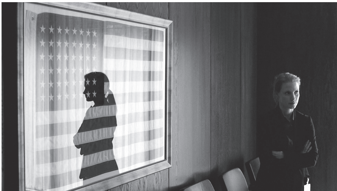
[4] Un film no es un rompecabezas que esconde un único significado. La noche más oscura (Zero Dark Thirty, Kathryn Bigelow, 2012).

ponen de relieve la llamada «falacia interpretativa». Es decir, la convicción de que un texto o film tiene un único significado: el texto/film no es un rompecabezas que esconde un único significado; es un objeto cultural / artístico con múltiples significados [4]. «Son entidades fracturadas que deben ser leídas como productos del inconsciente por medio de sus omisiones y silencios» (Kaes, 2009: 5). Y explicarlo es reconocer esta peculiaridad. De hecho, en el texto/film conviven diversos discursos: el explícito y el implícito, el presente y el ausente, mediante la presencia de una relación, o de una oposición, entre elementos de la exposición o niveles de la composición.